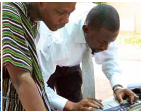
Centres d'Information Communautaires | Ghana