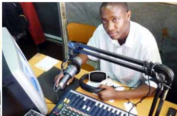
e-Brain Réseau National des TIC | Lusaka, Zambie