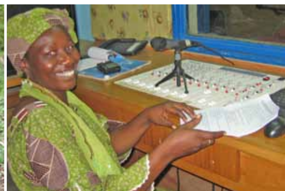
Projet Pag La Yiri | Zabré, Burkina Faso