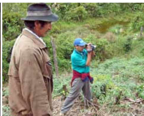
Agrecol | Bolivia