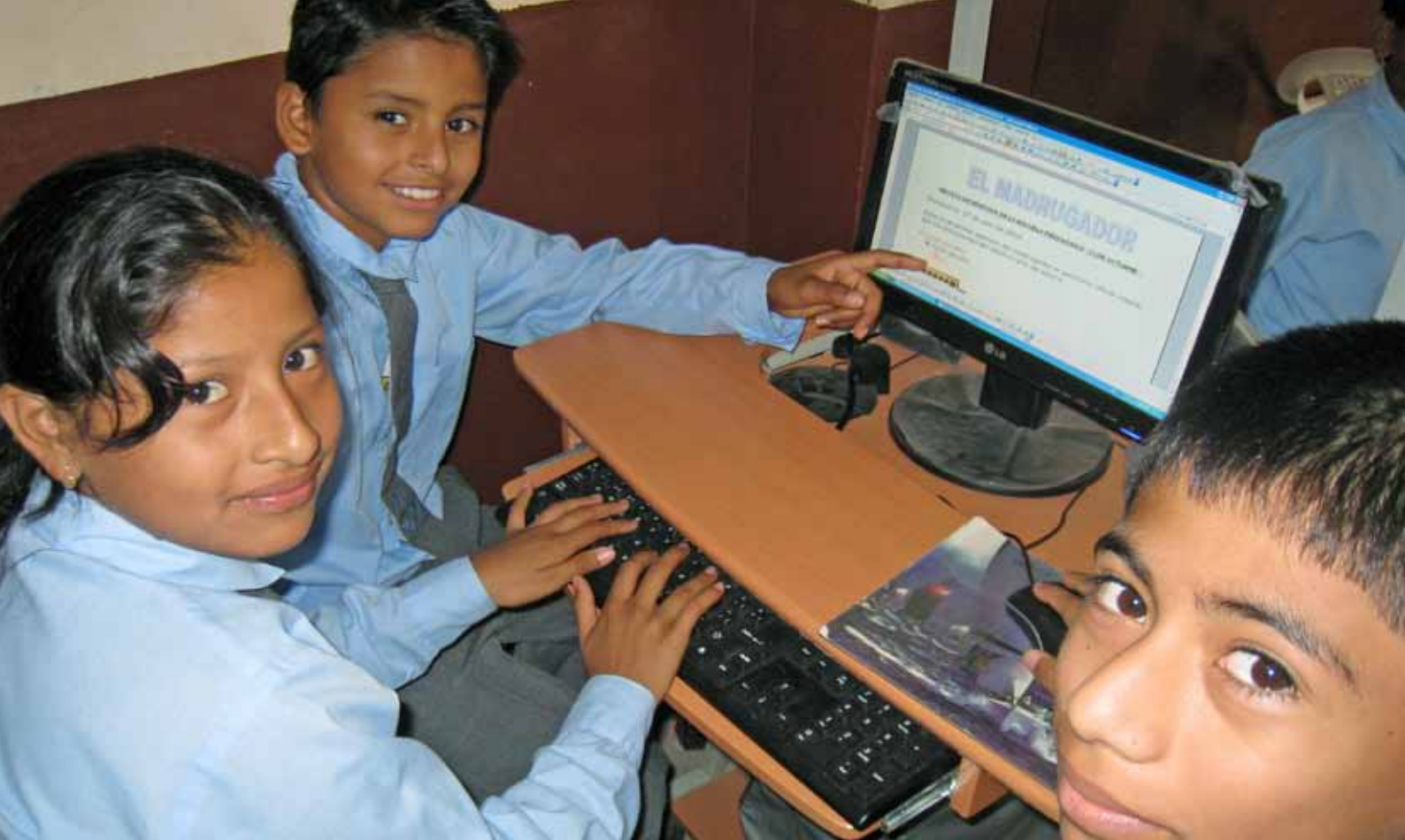
Télécentres Educatifs | Manabí, Equateur