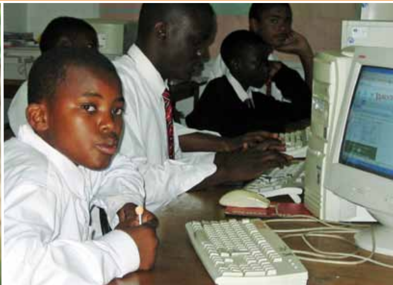
Projet ENEDCO | La Province du Copperbelt, Zambie