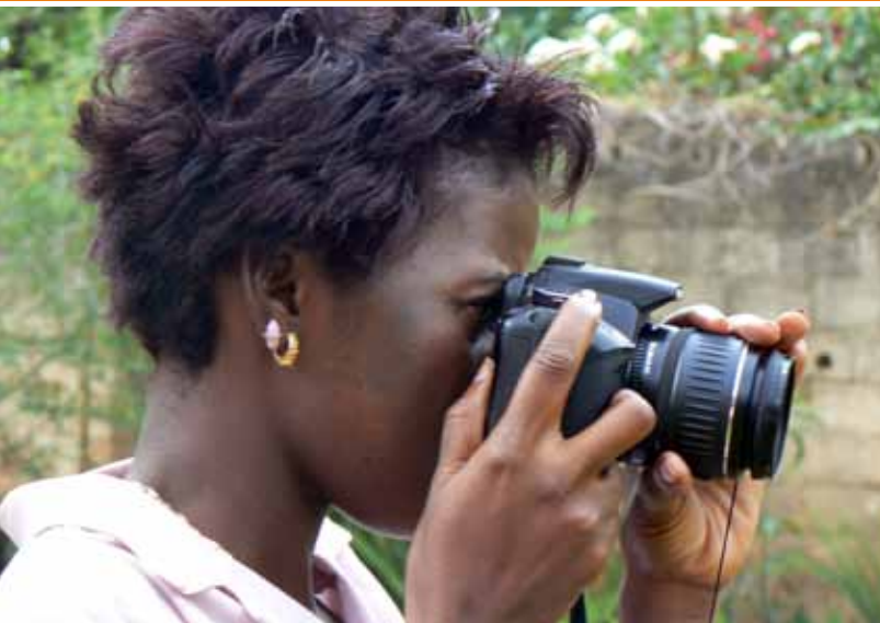
l'Intégration des TIC pour l'Assurance Qualité et de la Commercialisation | Zambie