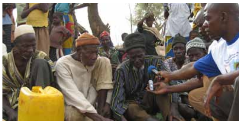
Sahel Solidarité | Bokin, Burkina Faso