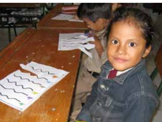
Telecentros Educativos | Manabí, Ecuador