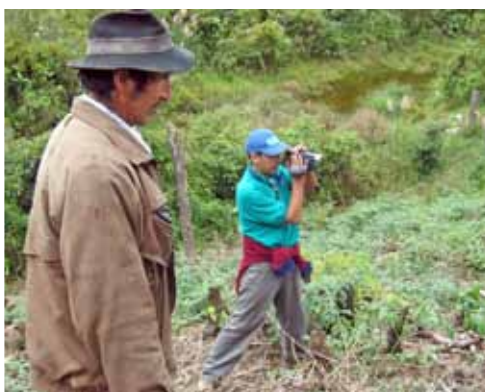
Proyecto Agrecol | Bolivia