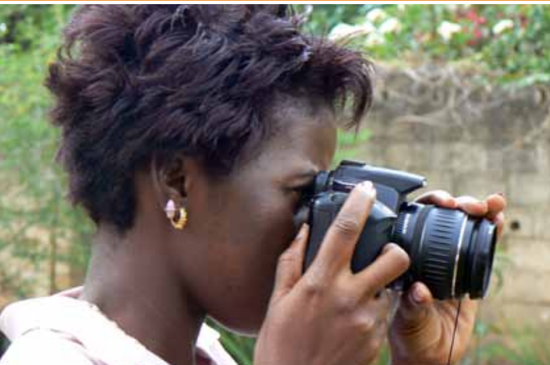
La Integración de las TIC en la comercialización y gestión de la calidad | Zambia