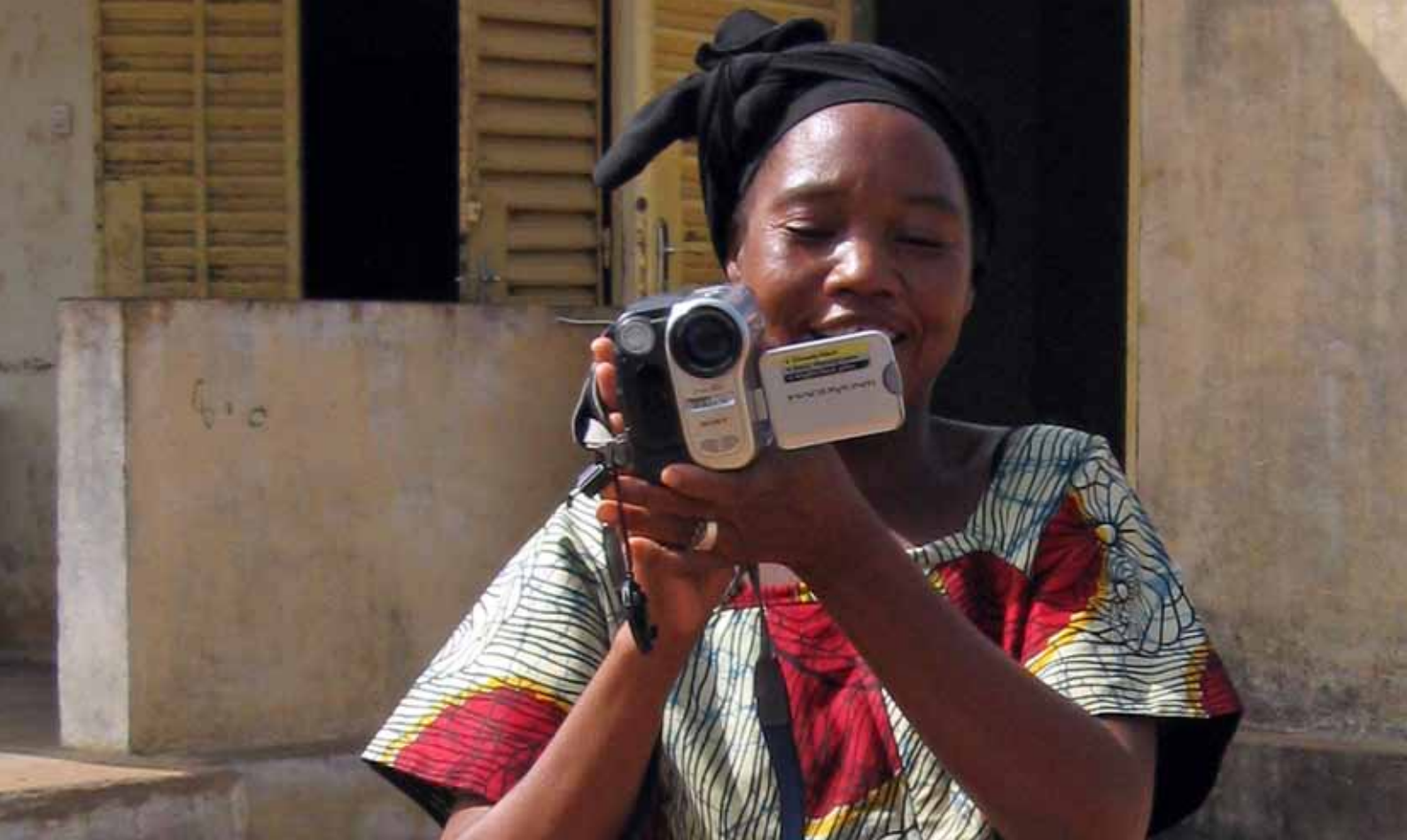
Evento de Aprendizaje entre Países | Malí