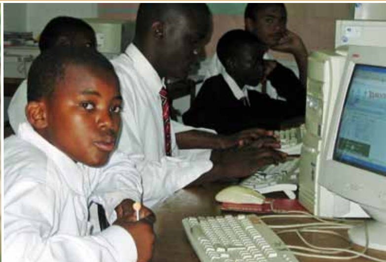
Proyecto ENEDCO | Copperbelt, Zambia