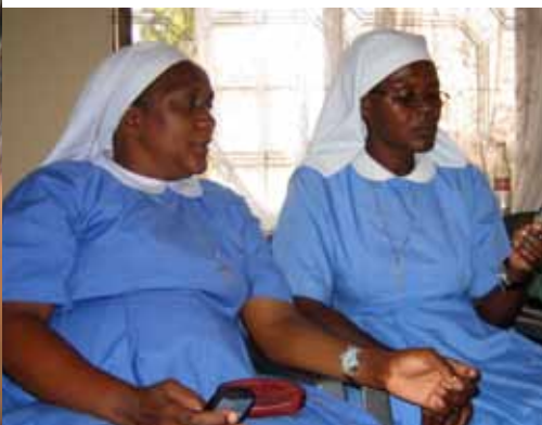
Sistema de Gestión Hospitalaria | Tanzania

‘Ochenta y cinco por ciento del presupuesto del IICD se gastó en la realización de proyectos, en el desarrollo de capacidades, en el intercambio de conocimientos y la evaluación.’