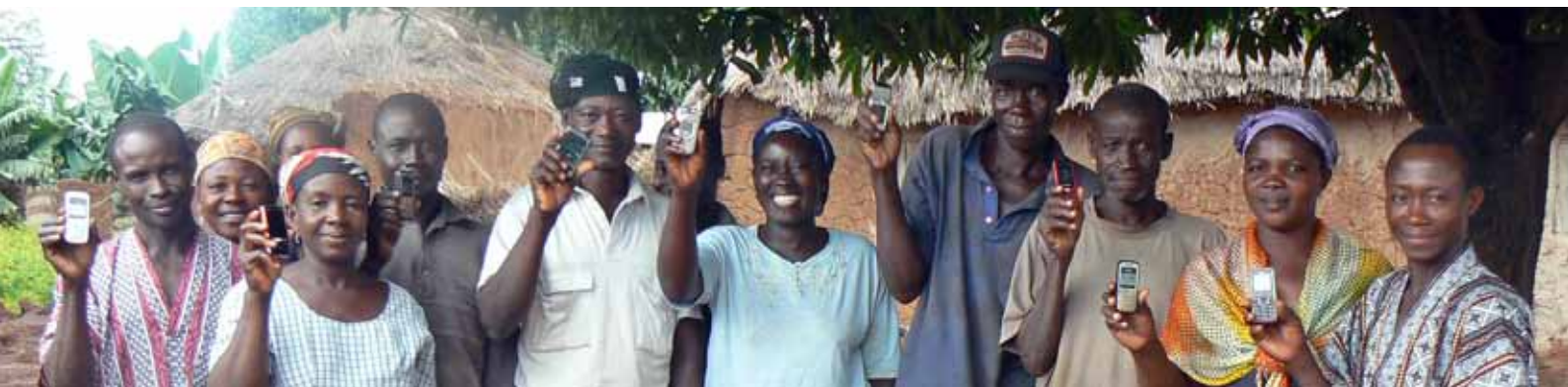
Proyecto ECAMIC | Kalende Comunidad, Ghana

‘Proyectos y programas apoyados por el IICD ayudaron a alcanzar a 813.000 personas que usan activamente la información o los servicios brindados por el proyecto y a 5.9 millones de personas que se han beneficiado de manera indirecta.’